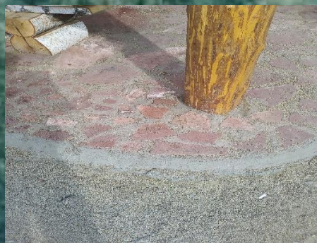
Рисунок 2. Площадка «Мангальной зоны»