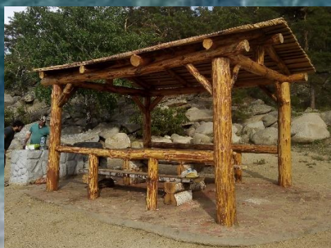
Рисунок 3. Беседка