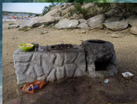
Рисунок 4. Стационарный мангал с печью для установки котла