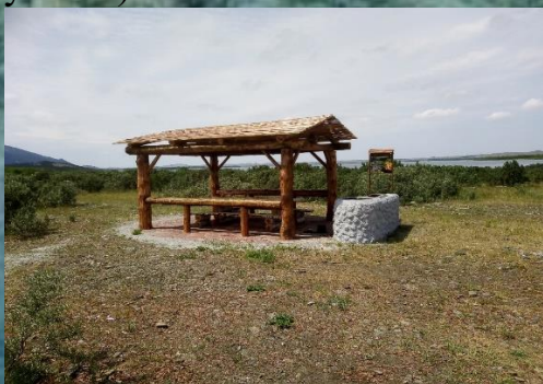
Рисунок 1. Мангальная зона.

Мангальные зоны (рисунок 1) это обустроенные места отдыха с возможностью использования стационарного мангала. Они включают площадку размером 4х6 м отсыпанную песчаной основой с уложенным на цементный раствор камнем-плитняком (рисунок 2); беседку из природного материала (длина 4 м, ширина 3 м, высота 3 м) (рисунок 3); внутри беседки установлены стол размером 2,9х0,9 м и лавочки с двух сторон, также из природного материала; на противоположной стороне от входа в беседку расположен стационарный мангал с печью для установки котла, выполненный из кирпича и природного камня оштукатуренный цементным раствором и побеленный известью (длина 2,4 м, ширина 0,7 м, высота 0,7 м) (рисунок 4); рядом с беседкой расположен стенд размером 1х0,9 м, высотой 2,5 м с правилами пользования «Мангальной зоной» (рисунок 5); на расстоянии 20-30 метров от беседки установлен деревянный контейнер для сбора мусора (рисунок 6).