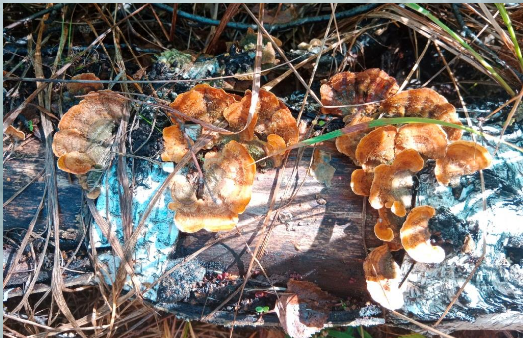
Рисунок 3. Сапротрофный гриб C. Versicolor

Современное фитопатологическое состояние березовых древостоев государственного национального природного парка «Бурабай» зависит от действия естественных факторов и результатов хозяйственной деятельности. Ведение хозяйства в лесах парка должно преследовать цель повышение их устойчивости и рекреационной привлекательности. Поэтому, важно проводить лесопатологический мониторинг и своевременно применять санитарно-оздоровительные мероприятия.